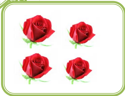
ดอกกุหลาบ